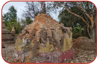
မြသိန်းတန်စေတီတော်ကို မိုင်းခွဲပြီး ဌာပနာဖောက်သွားတဲ့ ABSDF+PDF