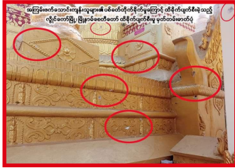
လွိုင်ကော်မြို့၊ မြို့နယ်စေတီတော်