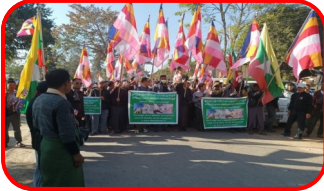
ပြင်ဦးလွင်

ဗုဒ္ဓဘာသာဝင်များ အထွဋ်အမြတ်ထားရာ ဘုရား၊ စေတီ၊ ပုထိုးများနှင့် ဘာသာရေးအဆောက်အဦများအားဖျက်ဆီးမှုနှင့် ပတ်သက်၍ အဖွဲ့အစည်း ၂၁ ဖွဲ့မှ ကန့်ကွက်ရှုတ်ချ