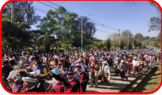
တောင်ကြီး