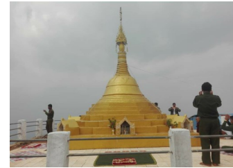
တပ်မတော်က ဘာသာ သာသနာ ပြန့်ပွားအောင် ဒီလို စောင့်ရှောက်တည်ထားကိုးကွယ်ခဲ့တယ်