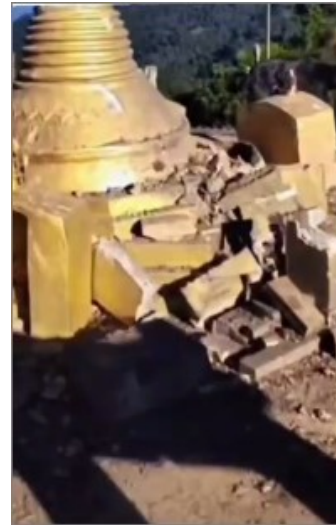
ဗုဒ္ဓဘာသာတွေ ယုံကြည်ကိုးကွယ်ရာကိုဒီလို တူ နဲ့ထုရိုက်ဖျက်ဆီးခဲ့တဲ့ MNDA မိစ္ဆာ

ဗုဒ္ဓဘာသာဝင်များ၏ ကိုးကွယ်အထွဋ်အမြတ်ထားရာ ဘုရား၊ စေတီ၊ ဆင်းတုတော်များကို ဖျက်ဆီးနေသော ပြည်ဖျက်မိစ္ဆာအကြမ်းဖက်များအား ဆန့်ကျင်ကြပါစို့