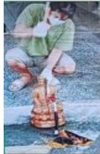
အကြမ်းဖက်မိစ္ဆာတွေ ဖျက်ဆီးသွားတဲ့ ဗုဒ္ဓဆင်းတုတော်