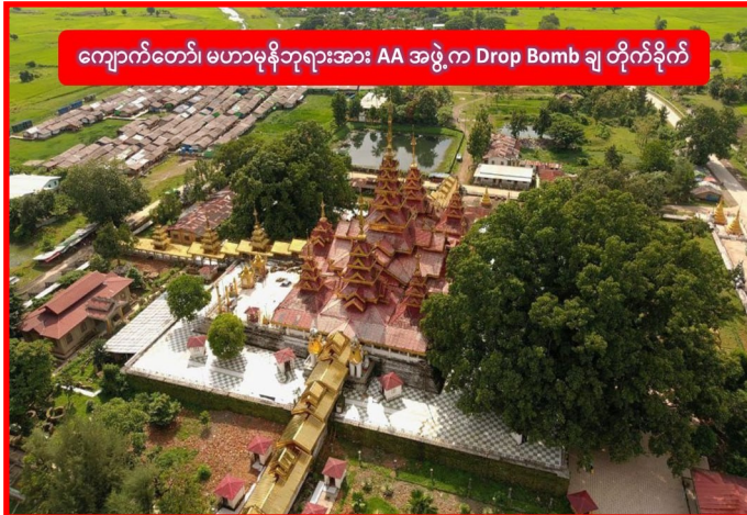
ကျောက်တော်၊ မဟာမုနိဘုရားအား AA အဖွဲ့က Drop Bomb ချ တိုက်ခိုက်